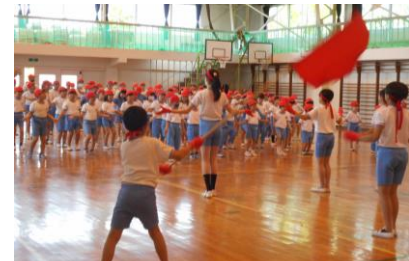
開会式の整列、赤組・白組の応援、亦小ソーラン、各学年種目など、運動会に向けてどの学年も練習に励んでいます。