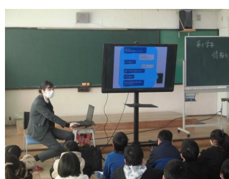
<5年生 情報モラル教室を行いました。>