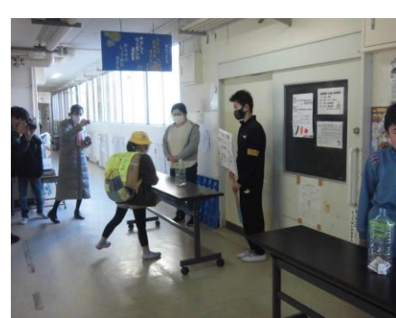
<能登半島地震の募金にご協力ありがとうございました>