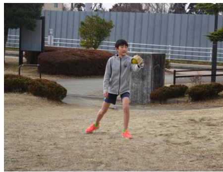
<各学年、大谷翔平選手から届いたグローブで遊んでいます>