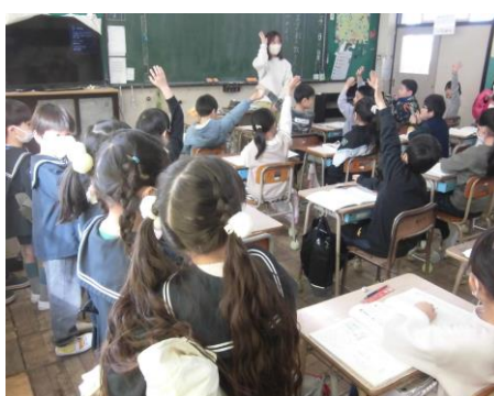
<幼保小連携活動の一環として町内の園児が学校見学にきました。>