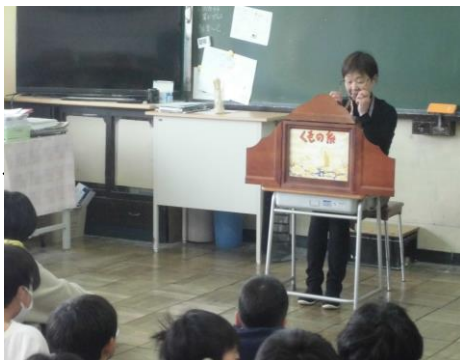
<「あゆみの会」の皆様、今年もありがとうございました。>