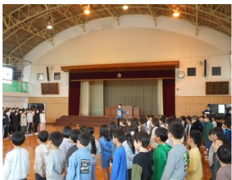
<音楽集会 「学校坂道」を全校で歌いました。>