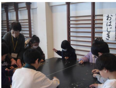
<1年生 生活科 地域のボランティアの方からおはじきやめんこ、お手玉など、昔の遊びを教えてくださいました。>