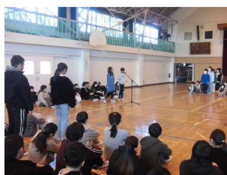
<児童集会 6年生から委員会活動を引継ぎました。>